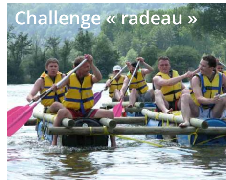
Challenge « radeau »