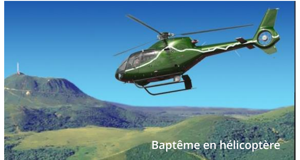
Baptême en hélicoptère