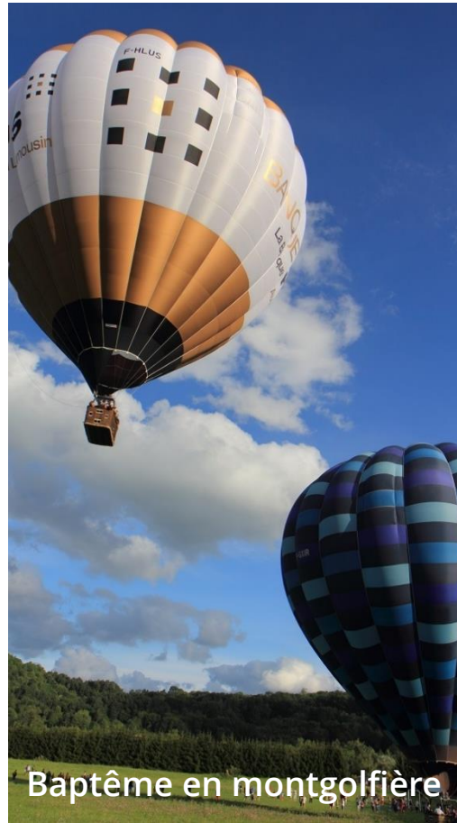
Baptême en montgolfière