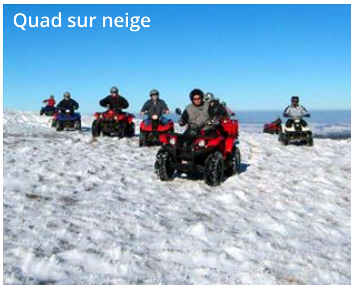
Quad sur neige